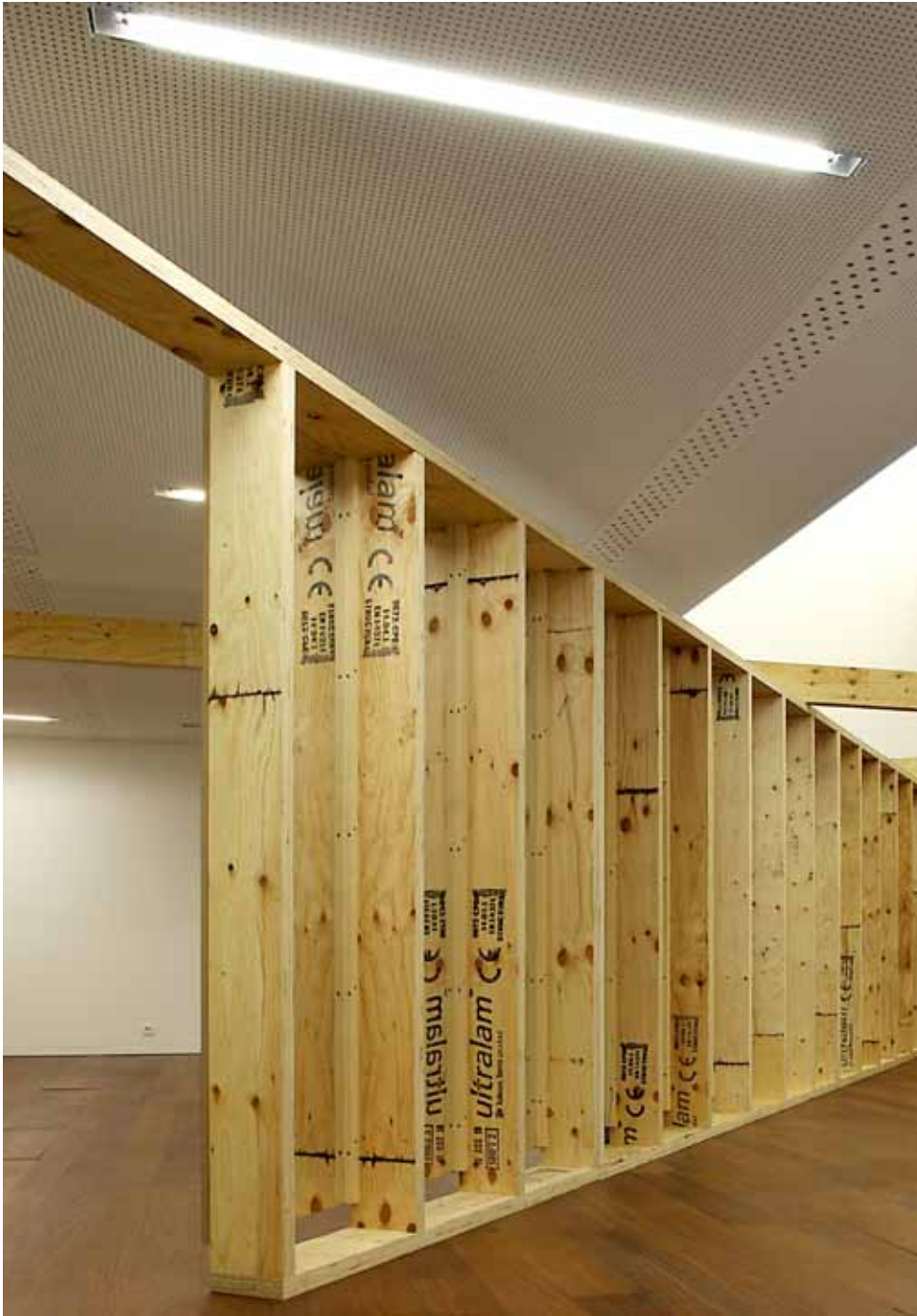
scenografie tentoonstelling, deSingel, 22 sep 2011 > 8 jan 2012

volledige cv, projectenlijst en publicaties www.architectendvvt.com