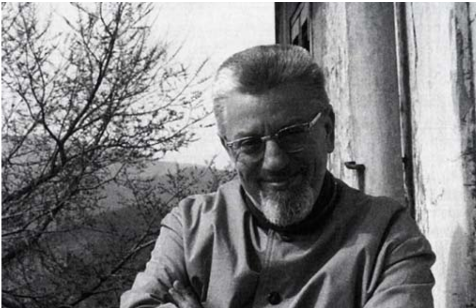
Bernd Alois Zimmermann

Werken voor viool solo waren oorspronkelijk een typisch Duits fenomeen. In de zeventiende eeuw zette Heinrich von Biber de toon met een reeks van 65 variaties op een bassthema, die ongetwijfeld als model diende voor Johann Sebastian Bachs beroemde Chaconne. Biber verstemde de snaren van de viool ('scordatura') om op die manier andere akkoorden speelbaar te maken, en hij schuwde ook andere technische hoogstandjes niet. Passages in de zevende positie, strijktechnieken als staccato, ricochet (waarbij de boog op de snaar 'gegooid' wordt en enkele keren op en neer botst), bariolage (waarbij eenzelfde toon op twee naast elkaar liggende snaren gespeeld wordt) en dubbelgrepen zijn slechts enkele van de technieken waarmee Biber het palet van de viool solo verrijkte. Bach heeft met zijn drie sonates en zijn partitas voor viool solo natuurlijk een ongelooflijk waardevol repertoire voor deze bezetting gecreëerd. Naast de muzikale diepgang valt vooral de geslaagde poging op om het instrument een reële meerstemmigheid te laten uitvoeren. Dat is mogelijk door de zoge-