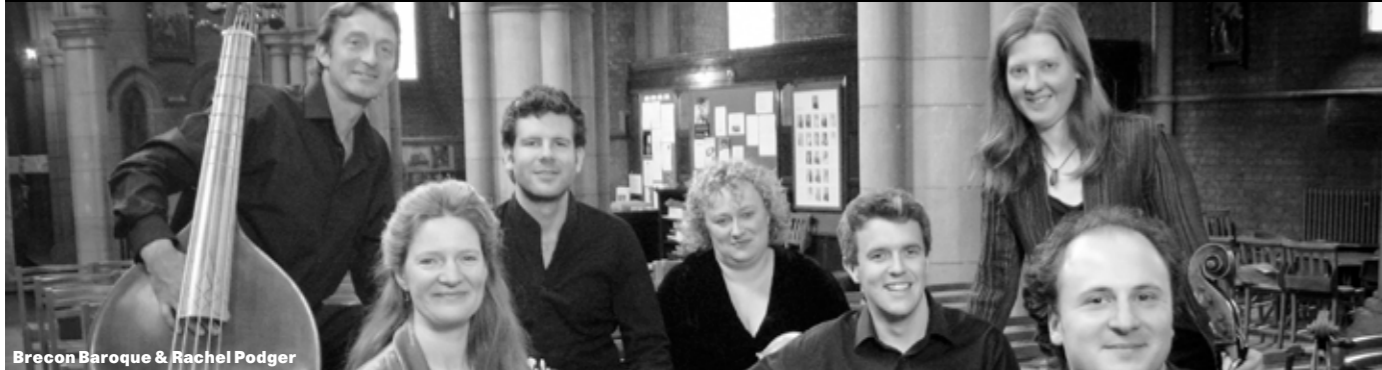
Brecon Baroque & Rachel Podger

€ 32, € 28, € 24 basis / € 28, € 24, € 20 -25/65+ / € 8 -19 jaar INLEIDING JAN DEVLIEGER 19.15 uur / blauwe foyer