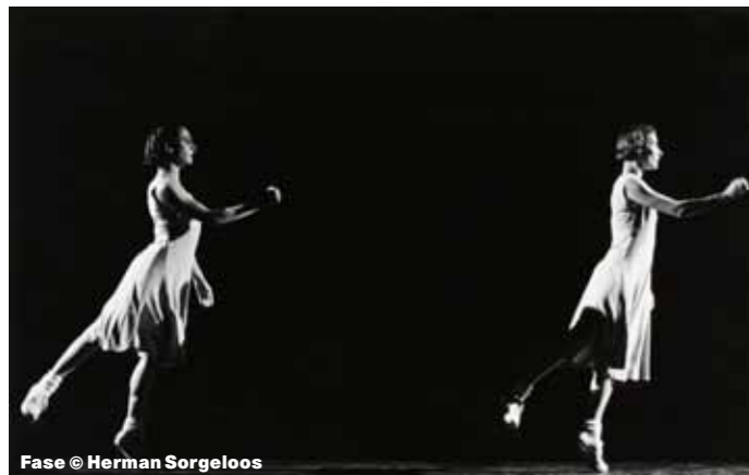
Fase