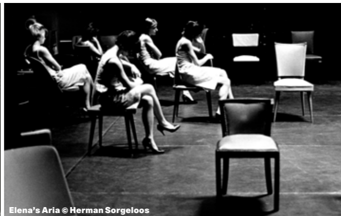
Elena's Aria