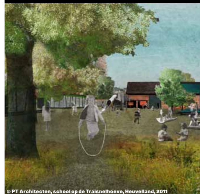
© PT Architecten, school op de Traisnelhoeve, Heuvelland, 2011

GROEPSRONDELEIDING max 20 pers. op aanvraag €60 reserveren via www.antwerpenaverechts.be