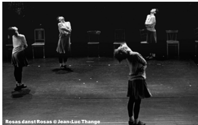
Rosas danst Rosas