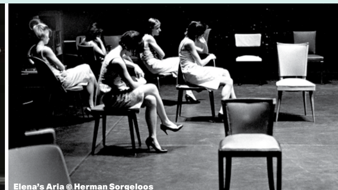
Elena's Aria © Herman Sorgeloos