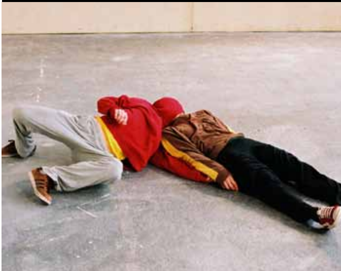
P.A.D. © Constance Neuenschwander

€ 18 basis / € 14 -25/65+ / € 8 -19 jaar