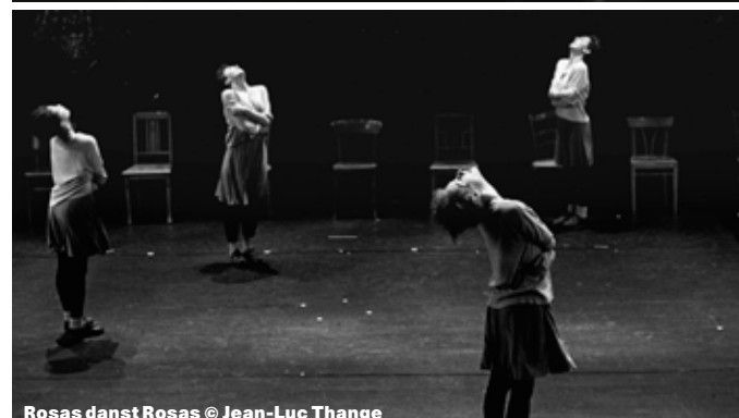
Rosas danst Rosas © Jean-Luc Thange