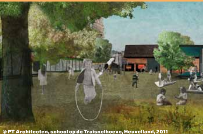
© PT Architecten, school op de Traisnelhoeve, Heuveland, 2011

ARCHITECTEN DE VYLDER VINCK TAILLIEU PT ARCHITECTEN