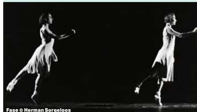
Fase © Herman Sorgeloos

Van het vroege werk van een kunstenaar gaat vaak een blijvende fascinatie uit. Omdat deze stukken embryonaal de leefwereld, the-matiek en vormtaal bezitten die de kunstenaar in zijn latere oeuvre openplooit en uitdiept. Tijdens twee opeenvolgende weekends presenteren we vier 'Early Works': 'Fase, Four Movements to the Music of Steve Reich' (1982), 'Rosas danst Rosas' (1983), 'Elena's Aria' (1984) en 'Bartók/Mikrokosmos' (1987). Deze vier choreografieën hebben als rode draad vrouwelijkheid en de aarzelende overgang van meisje tot vrouw. Een evenwichtsoefening tussen gevoelsmatigheid en abstractie. "Emoties zijn altijd een grote leidraad geweest in wat ik doe, maar aan de andere kant is er steeds een soort verlangen naar abstracte schoonheid, naar een onverbiddelijke, op zichzelf staande orde", aldus de choreografe.